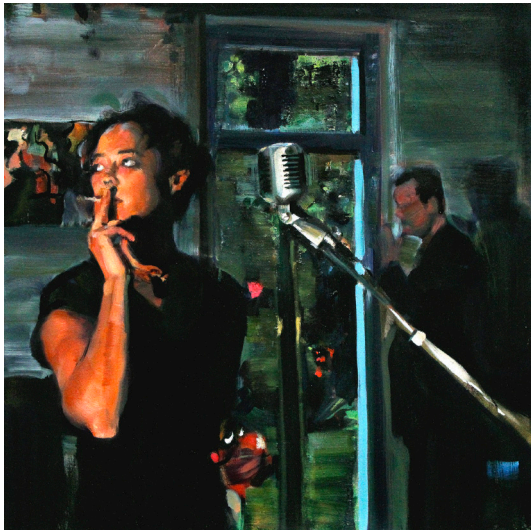
Markus Fräger | Die Sängerin | 2014 | Privatsammlung Freifrau von Massenbach, Köln

Scheinbare Alltagsszenen erfasste Markus Fräger schnappschussartig. Doch entwickeln die abgebildeten Menschen in ihren Posen ein Eigenleben, wirken in ihren Gesten aus der Zeit gefallen. Die rätselhaften Szenarien, die der Künstler aus unterschiedlichen inhaltlichen und zeitlichen Ebenen collagiert, verwenden bildliche Zitate aus der Kunstgeschichte, zahlreiche eigene und gefundene Fotografien sowie Abbildungen aus Magazinen und Zeitschriften.