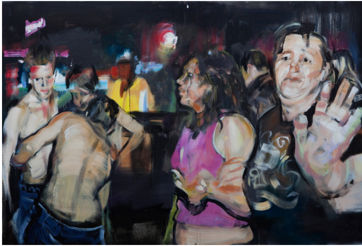
Markus Fräger | Am Ausgang | 2009 | Privatbesitz

Die Ausstellung im Museum Schloss Cappenberg zeigt retrospektiv das malerische Werk von Markus Fräger. Er malte überwiegend figurativ, seine dichten Szenen von fast altmeisterlicher Anmutung mit starken Hell-Dunkel-Kontrasten spielen oft in Innenräumen und erinnern sowohl an die Tradition der Genremalerei als auch an kinematografische Filmstills. Ähnlich wie ein Regisseur setzt Markus Fräger seine Motive in Szene zusammen. Die Komposition der Figuren sowie auch deren Gesten deuten eine Handlung an, die sich aber im Bildgefüge nicht schlüssig zusammensetzt, sondern eine Geschichte mit losen Enden bewusst auf verschiedenen Zeitebenen erzählt. Auch nach einer intensiven Betrachtung bleiben die Szenen rätselhaft, erscheinen manche formalen Elemente ebenso kryptisch wie die inhaltlichen – punktuell zeigen die Strukturen Auflösungserscheinungen und entziehen sich einer Interpretation. Markus Fräger lässt private und intime Momente unbedingter Schönheit und zärtlicher Verletzlichkeit entstehen, die an die Vergänglichkeit eines scheinbar festgehaltenen Moments erinnern.